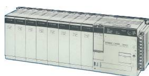
オムロン社製 C200H及びαシリーズ